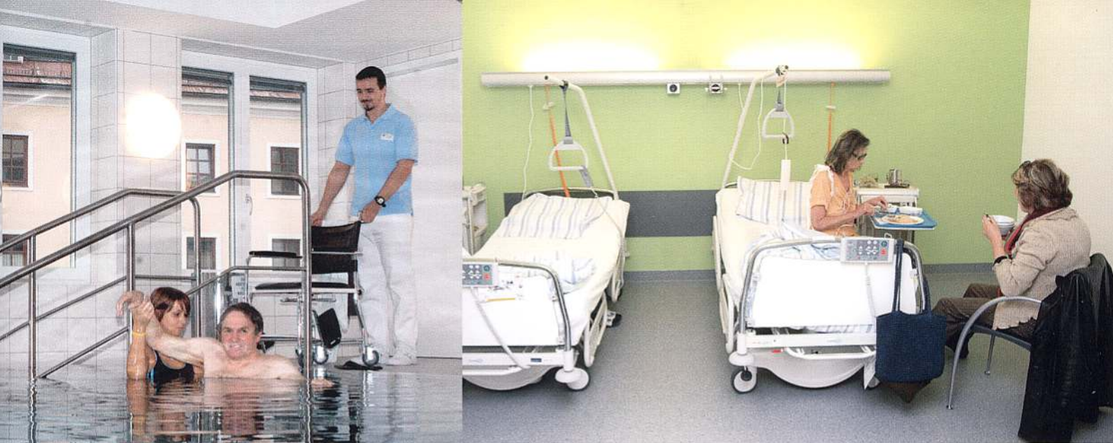
[ Das speziell für mobile und immobile Patienten entwickelte Bewegungsbecken